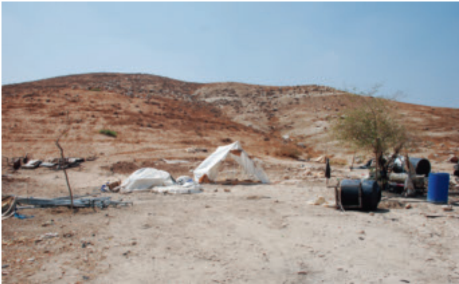
Al-Farsia. Tältet har också fått en rivningsorder.